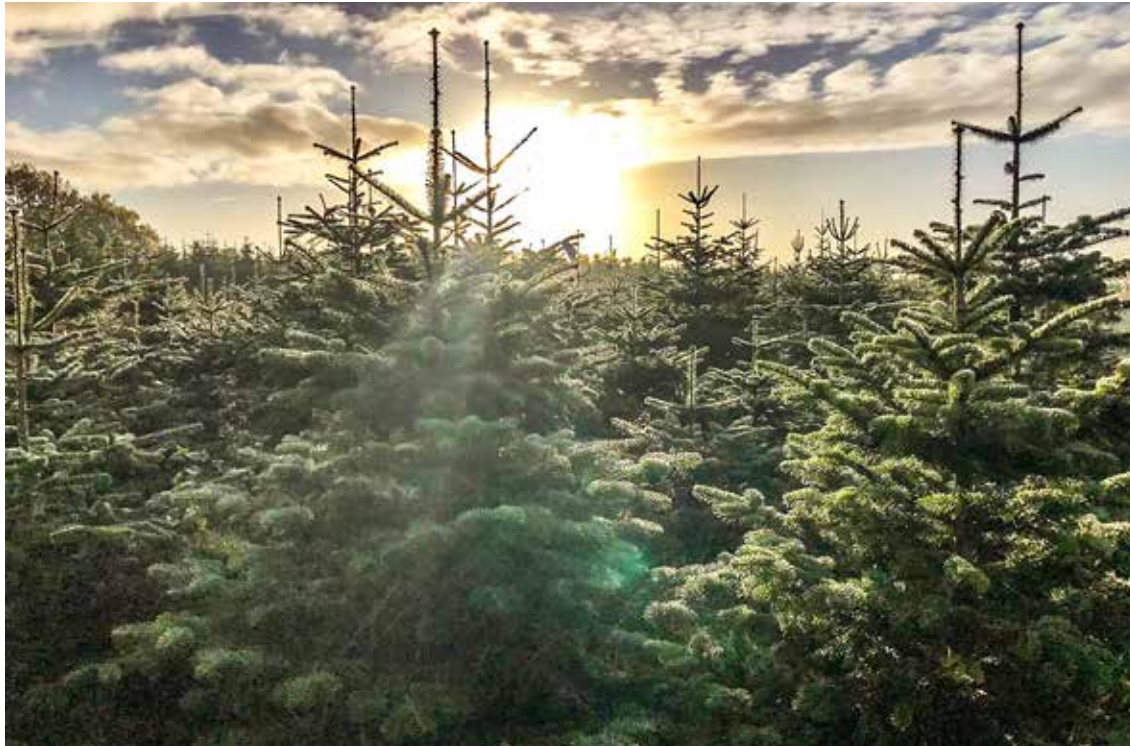
Die Weihnachtsbaumkulturen gehören zum Wirtschaftsteil eines land- und forstwirtschaftlichen Betriebes und werden dem Bereich der übrigen land- und forstwirtschaftlichen Nutzung zugeordnet.

ar. Ein Arbeitsgang für das Pflanzen und Antreten mit einer zweireihigen Pflanzmaschine und einem 83-kW-Schlepper sowie drei Arbeitskräften und einem Lohnansatz von 17 € pro Stunde wird unterstellt. Der Preis für dreijährige Sämlinge ist veranschlagt mit 0,34 €. Die Grunddüngung wird durch ein Lohnunternehmen vorgenommen und mit 7,50 €/t berechnet. Hierfür werden 2 t Kalk à 41 € eingeplant. Die Fläche wird mit einem 83-kW-Schlepper und einer 3-m-Kreislege vorbereitet.