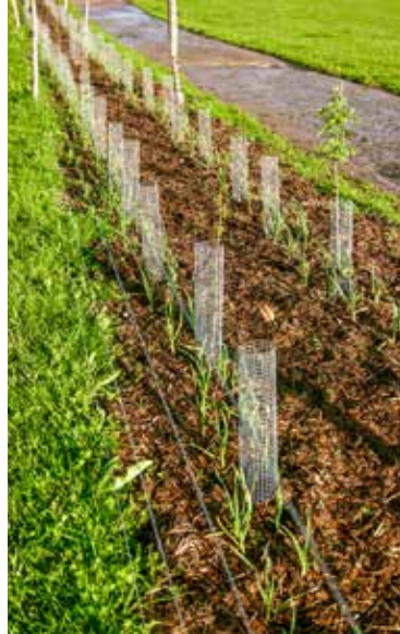
Junge Futterlaubhecke als Agroforstsystem mit Baumschutz gegen Hasen und Rinder sowie Knoblauch als Unterkultur

Das Netzwerk Ökolandbau Schleswig-Holstein lädt Landwirtinnen und Landwirte zu einer Betriebsführung auf den Eichhof der Familie Riecken („rieckens landmilch“) in Großbarkau ein. Der Termin findet statt am Freitag, 10. Dezember, von 10 bis 13 Uhr. Der Eichhof wurde für sein innovatives Betriebskonzept mit mehreren Agroforstsystemen in diesem Jahr mit dem Nachhaltigkeitspreis des Landes Schleswig-Holstein ausgezeichnet. Die Veranstaltung ist kostenfrei.