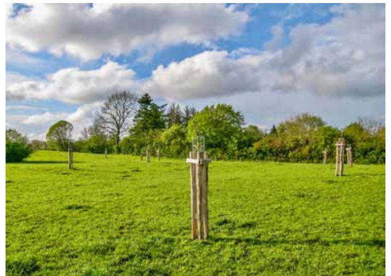
Anpflanzung einer modernen Streuobstwiese als Agroforstsystem mit Rindenbaumschutz

Ida Herzberg Netzwerk Ökolandbau Schleswig-Holstein Tel.: 0 43 31-94 38-172 ida.herzberg@ oekolandbau-sh.net